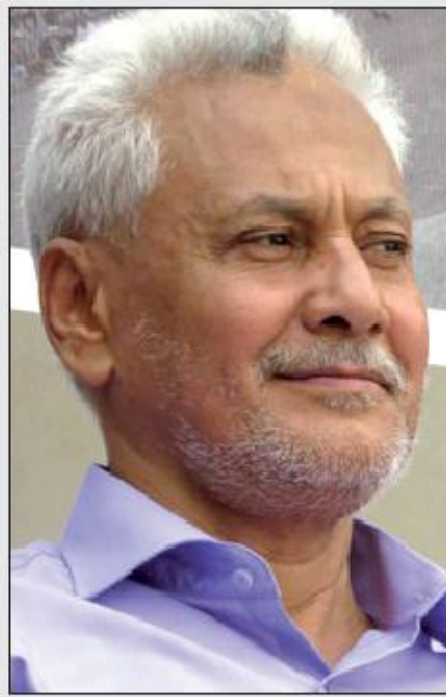
حسين زيد بن يحيى

إن قدرة قوى ثورة 21 سبتمبر في التعااطي مع الحالة الجنوبية المريضة حالياً ليس لمصلحة الثورة فحسب بقدر ماهي مصلحة إستراتيجية لكل اليمن وضمانة لهزيمة العدوان وكل مشاريع قوى الوصاية، حجم التحدي كبير وهزيمة العدوان تعتمد على نجاح القدرة على التعامل مع الحالة الجنوبية وإعادتها للحالة الوطنية اليمنية المقاومة للمشاريع الصغيرة صنعية الاستعمار والصهيونية والرجعية ، لهذا فإن إعفاء الطاقم السابق المتابع للملف الجنوبي في المجلس السياسي لأنصار الله لدليل على جدية وأهمية الحالة الجنوبية التي يستشعر بها السيد القائد عبدالله بدر الدين الحوثي ، تقييم موضوعي جاد لا يقف فقط عند إعفاء طاقم محدد بعينه بل تمت عملية مراجعة نقدية لإيجابيات القيادة السابقة والتأشير بوضوح لمواطن الضعف والتقصير وهذه هي الحالة الثورية الصائبة الراضية للتفوق والجمود.