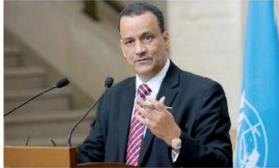
كافة النقاط التي ستكون في اتفاق السلام. فيما كشف مصدر سياسي لوكالة خبر لأخبار عن مساع يجريها المبعوث الخاص للأمم المتحدة إلى اليمن، إسماعيل ولد الشيخ أحمد، لعقد جولة المشاورات، حسب مصادر غربية من المبعوث الأممي. وروجت المصادر، أن لقاء الجولة للبلدية في دولة الكويت أو في جنيف، إذا ما تم الاتفاق على

مشاورات جديدة. وأشار المصدر إلى أنه لم يتم مناقشة مكان وزمان عمل الجولة، حتى اللحظة. مؤكداً أن ولد الشيخ سيبحث ذلك خلال زيارته المرتقبة إلى العاصمة اليمنية صنعاء. ووصل المبعوث الأممي في وقت سابق إلى العاصمة السعودية الرياض. في إطار جولة في المنطقة للدفع باتجاه هدنة شاملة تبدأ بنهاية مايو الجاري. تهيئ لاستئناف محادثات السلام اليمنية. وتشمل جولة ولد الشيخ، الرياض، مسقط، وصنعاء، وبحسب المصادر، فإنه من المرجح أن يصل ولد الشيخ خلال الساعات القادمة. وقال المصدر إن اللقاءات مع ولد الشيخ تجت مع الأطراف المعنية آلية للاتفاق على وقف شامل للعمليات العسكرية، يليه تحديد مكان وزمان استئناف المفاوضات المتوقفة منذ نهاية أغسطس من العام الماضي. وتدفع الأمم المتحدة، عبر مبعوثها الخاص، باتجاه اتفاق لوقف إطلاق النار في اليمن، والخروج في هدنة إنسانية، تهيئ المناخ لاستئناف