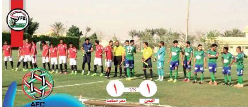
وعن المقرر أن يخوض منتخبنا الوطني يوم السبت القادم مبارياته الثانية في معسكره بدمياط