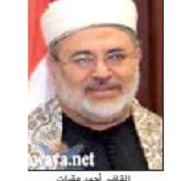
القاضي احمد معاتب

أخرى إلى جانب المترتب، ولوظائف الذين يتقاضون مرتباتهم من الجهات التي يعملون فيها طيلة فترة العدوان». وأهاب وزير العدل بجميع القضاة مراعاة ظروف الموظفين للمستأجرين عند نظر الدعاوى المتعلقة بالإيجارات خلال فترة الرهنة التي تصر بها بلادنا وبما يكفل الحفاظ على حقوق المؤجر والمستأجر وهنا لا يعني ضياع الحقوق ولكن تقدير ظروف المرحلة بما تستحقه مصداقاً لقوله تعالى «والعسر إن الإنسان لفي خسر إلا الذين آمنوا وعملوا الصالحات وتواصوا بالحق وتواصوا بالصبر» صدق الله العظيم. ووفقاً لوزارة العدل فقد جاء هذا التعميم بعد أن لوحظ مؤخراً كثرة الدعاوى المقدمة من المؤجرين على الموظفين المستأجرين بتسليم إيجارات للسكان وأخلاء المسكن للوجرة بسبب تأخر المرتبات جراء العدوان الغاشم على بلادنا والذي تقوده السعودية. ■