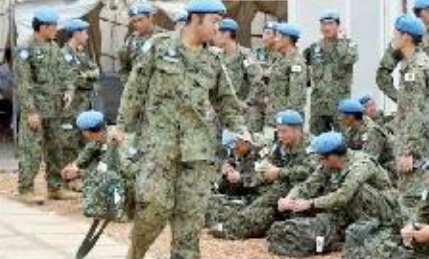
مصدر عن المؤتمر الشعبي العام

قال تقرير أصدرته الأمم المتحدة أن حكومة الرئيس سيلفا كير ميارديت في جنوب السودان تتحمل مسؤولية معظم أعمال القتال في البلاد. وأضاف التقرير الأممي أن حكومة جنوب السودان تتحمل بالتالي المسؤولية عن الجاعة التي نشفت في البلاد بسبب القتال. وجاء في التقرير الأممي الذي أعدته لجنة من الخبراء أن العمليات الهجومية نفذها عادة ميليشيات وجنود من إثنية الدينكا التي ينتمي إليها رئيس جنوب السودان. وأضاف التقرير الأممي أن هؤلاء القتالين يستفيدون من أسلحة ثقيلة حصلوا عليها أخيراً بما في ذلك طائرات الهيلوكبتر الهجومية.. لكن ناطقاً باسم الرئيس رفض هذه الاتهامات قائلاً إن التقرير منحاز، مضيفاً أن من تولوا إعداده ليسوا خبراء.. ويدعا التقرير إلى فرض حظر على تصدير السلاح لجنوب السودان، لكن مجلس الأمن الدولي رفض سابقاً هذه التوصية. واستقال