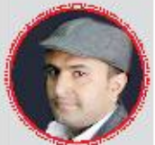
الواحدى: المثقف يتعرض باستمرار للتمهيش والتجاهل