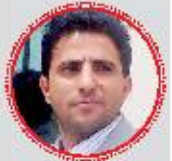
الضيبي: المثقف يعيش الصراعات والحروب واقعا من