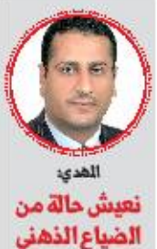
المهدي نعيش حالة من الضباب الأدبي

ويشير الدكتور المهدي إلى مسألة هامة مرتبطة بما ينتجه اليوم للمثقف خاصة في عمل إبداعي يساهم في التنمية خاصة في ظل المرحلة التي يعاني منها المثقف على وجه الخصوص بولوه " وتؤكد بأن هناك دوراً ضامناً للثقافة والمثقفين المفترض بأنهم حصن الأمة ومادام يكن هذا الحصن قوياً وقادراً على التوعية والبناء. حقيقة لم نجد في هذه المرحلة التي يعانيها مجتمعنا من حرب وحصار وجوع ومرض ومعاونة وكل ما يشعر به ويعيشه كل مواطن،