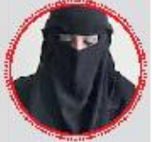
القليبي: دور المثقف هام في ظل الشتات وولايات الحروب