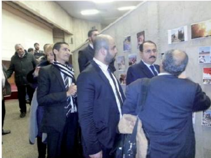
تماما عما يجري من إزهاق لأرواح البشر في اليمن.

يردف الليث: بعد أن وصلت موسكو وأجريت الفحوصات الطبية والعلمية .. وتمثلت للشهيد سريعا، وقدناك بدأنا على تنفيذ الترتيبات، وما حلزني أكثر، عندما كنت في المشفى، فوجدت بعض الأطباء الروس إنهم لا يعلمان أن اليمن في خازطة العالم، تاهيك من أن الرأي العام الروسي حينها تاهيب