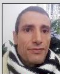
الليث: استعارة «العلم السوري» لإقامة فعالية في روسيا تبرز جرائم العدوان