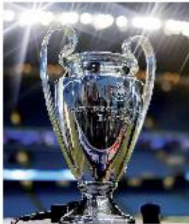
الشماني بالدور الأول.

في دور المجموعات بالمستوى الثاني. وعملت القرعة على وضع كل فريق بالمستوى الأول مع فريق من المستوى الثاني مع تجنب عدم وقوع أي فريق في مواجهة الفريق الضامن معه من نفس مجموعتهما بالدور الأول كما جئبت القرعة الفرق التي تنتمي لاتحاد أهلي واحد من الوجود سويدي في هذا الدور. وتقام مباريات جولة الذهاب بدور الستة عشر للبطولة في أيام 14 و15 و21 و22 فبراير المقبل فيما تقام مباريات جولة الإياب أيام السابع والثامن و14 و15 مارس المقبل. وطبقا للوائح هذا الدور من البطولة، ستكون مباريات الذهاب على ملاعب الفرق التي جاءت في المستوى الثاني فيما ستكون مباريات الإياب على ملاعب الفرق التي جاءت في المستوى الأول والتي تصدرت مجموعتها في الدور الأول للبطولة. وتقام المباراة النهائية للبطولة هذا الموسم في الثالث من 2017 على استاد "ميلينوم" في كارديف.