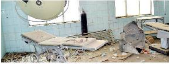
مستشفى الثورة باب

ناشد محافظ إب عبد الواحد صلاح، مطلع هذا الأسبوع، منظمة الصحة العالمية والمنظمات الدولية التدخل السريع والعاجل لإنقاذ حياة أكثر من 500 من مرضى الغسيل الكلوي وزارعي الكلى... مشيراً إلى توقف مركز الغسيل الكلوي بالمحافظة نهائياً جراء انعدام الأدوية والمحاليل الطبية.