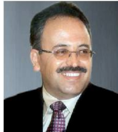
الوحدة/ حمود المرهبي:

تتعلق صباح غداً الخميس بطولة الشهيد عبدالقادر هلال لكرة القدم بجامعة دار السلام، وتقام المباراة التي يحتضنها ملعب جامعة دار السلام، بين فريقى «الاعلام» و«التجارة» ضمن المنافسات الرياضية على كأس شهيد الوطن اللواء عبدالقادر هلال لكرة القدم. وتأتي هذه المباراة الكروية عرفنا لنودور الشهيد الامتنان ورجل السلام هلال، الذي بذل جهده ووقته في خدمة الوطن.