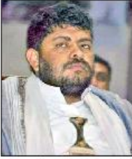
محمد علي الحوثي

المؤسسات المستقلة مالياً وإدارياً بالإضافة من حالتها خلال العدوان والتأثيرات والانعكاسات التي نجمت عن تعثرها أو توقفها أو اختلال عملها وانعكاسات ذلك على القطاع الوظيفي والعاملين فيها وتحمل موازنة الدولة إعادة صرف رواتبهم وتعريضهم لأضرار مادية ونفسية مضاعفة " وأشار رئيس اللجنة الثورية العليا إلى تعامل بعض القطاعات في إعداد الموازنة وتقديمها إلى بعض الجهات دون مراعاة الظروف الراهنة والإيريك وعدم الانتظام في بعض القطاعات وانعكاس ذلك على الوفرة المالية وخلق مشكلات مضاعفة ناتجة عن الفساد وعدم الاستقرار الإداري والمالي في بعض المحافظات، وعدم الاهتمام بتحصيل المديونات الخاصة بالدولة ومؤسساتها لدى الجهات الرسمية والخاصة والأفراد كما هو حاصل في الكهرباء وغيرها من المؤسسات.