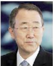
بان كي مون

ذكرت مصادر يمنية في العاصمة صنعاء، لوكالة "أخبر"، أن مؤشرات وصفتها بـ"الجيدة"، قد تقضي لانطلاق مبادرات السلام التي تستضيفها دولة الكويت، مرجحة أن الساعات القادمة ستشهد الفرجة في مسار السياسي بشأن أجندة المفاوضات ووقف العمليات القتالية.. ومصعب المصادر، فإن اتصالات مكثفة على غير مسار شهدتها العاصمة صنعاء، خلال الساعات الماضية، وأن مؤشرات جيدة تتبصر بإنجاز تفاهات من شأنها انطلاق المبادرات السياسية بين الأطراف.