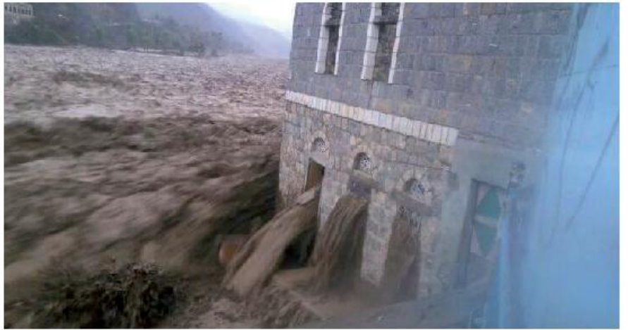
أحد المنازل في حجة أثناء تدفق السيول

واضاف أن عناصر من تنظيم القاعدة قاموا بتفخيخ المطار وزرعوا الألغام تحسبا من إنزال جوي وهجوم بري خلال الأيام القادمة وقد سيطر تنظيم القاعدة على ساحل حضرموت منذ عام كامل.. ■