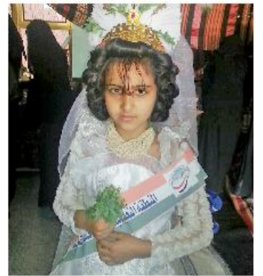
لوحات استعراضية لأبناء وبنات العاصمة عبرت عن الاخاء والمحبة والسلام بين اليمنيين.